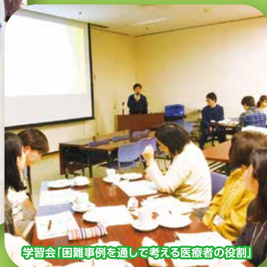
学習会「困難事例を通して考える医療者の役割」