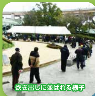
炊き出しに並ばれる様子

年末に「神戸・越年越冬ボランティア」に医系学生18名が参加しました。ボランティア活動後、交流会を開きました。