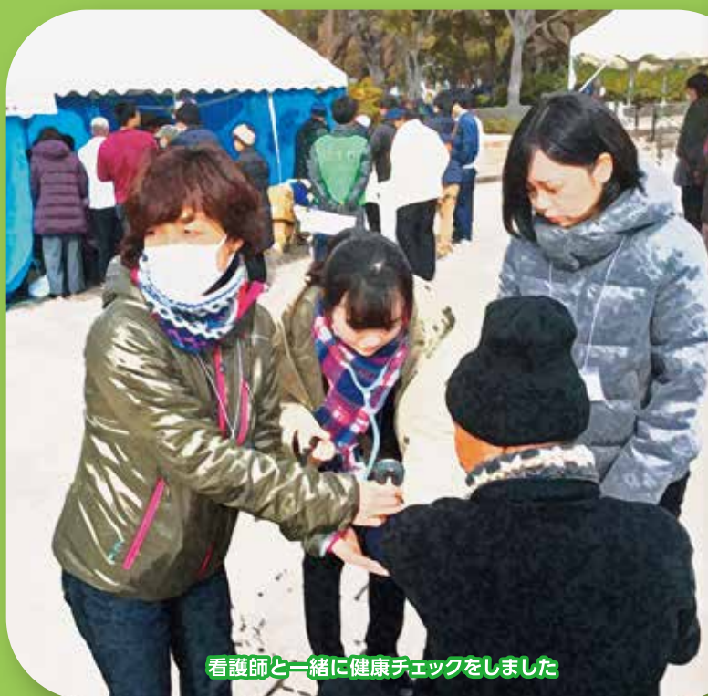
看護師と一緒に健康チェックをしました