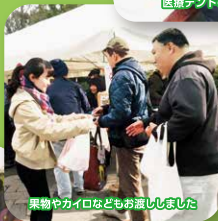
果物やカイロなどもお渡ししました